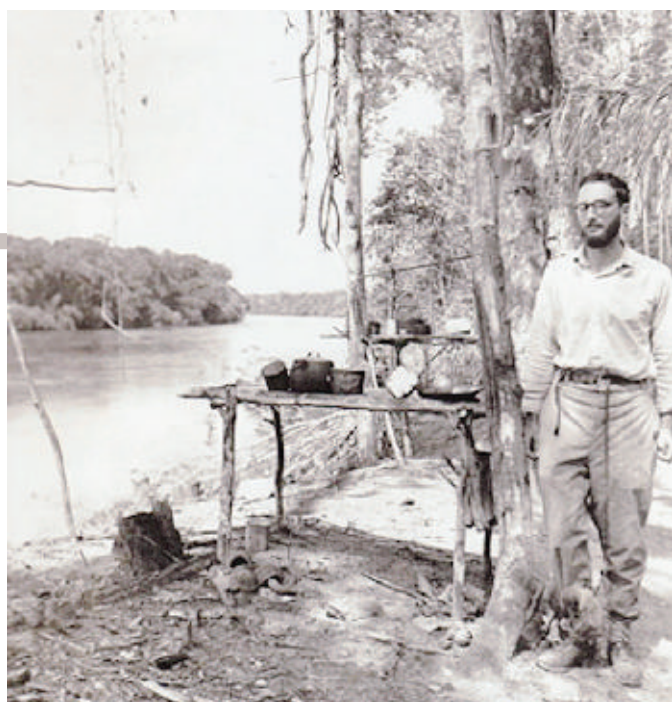
Claude Lévi-Strauss in un'autoscatto degli Anni 30 presso la tribù dei Nambikwara in Amazzonia, con la scimmietta Lucinde aggrappata a una gamba: è la foto a cui era più affezionato