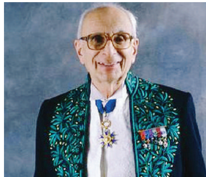
Claude Lévi-Strauss con l'uniforme di «Immortale di Francia»

Il crudo e il cotto 1964, tradotto dal Saggiatore. A partire dallo studio di un mito degli indigeni amazzonici, Lévi-Strauss individua nel fuoco un elemento di mediazione tra uomo e natura, stabilendo l'equazione tra «cotto» e «civillizzato».