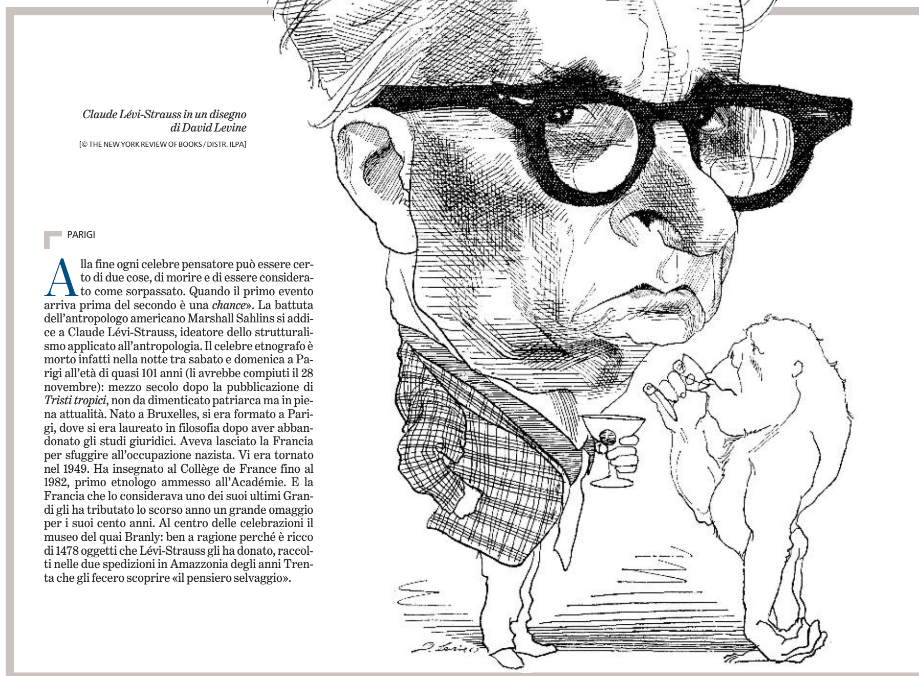
Claude Lévi-Strauss in un disegno di David Levine

In fondo, da giovane, aveva scelto la seconda opzione, quando nel 1935, dopo la laurea in filosofia, presagendo che la carriera accademica non gli sarebbe riuscita facile, era andato a vivere fra le tribù indigene dell'Amazzonia e del Mato Grosso. Era stato compagno di studi di Simone de Beauvoir e Merleau-Ponty, ma la sua mente, polimorfa e multidisciplinare fin dall'infanzia, dedita alla pittura e alla musica quanto alla scrittura e alla lettura, era intollerante alle sistematizzazioni. Fu una duplice sconfitta al Collège de France a dargli quella straordinaria libertà di scrit-