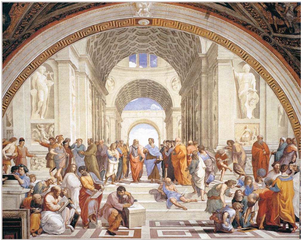
Affresco La «Scuola di Atene» di Raffaello, con al centro Platone e Aristotele